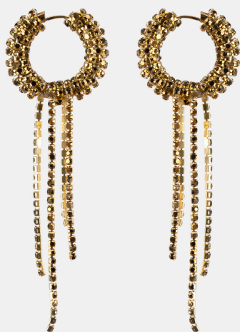
BOUCLES D'OREILLES DANCING QUEEN - GOLD / 75€