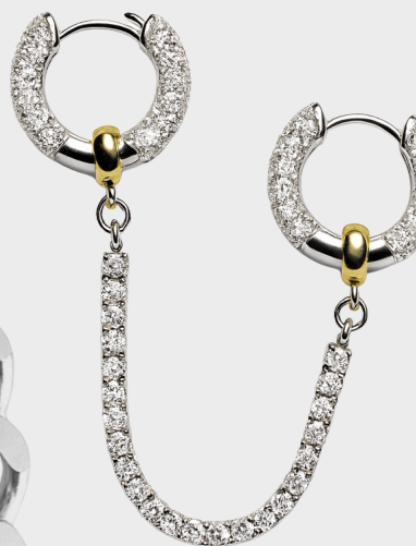
BOUCLES D'OREILLES MOON 3 en 1 / 75€