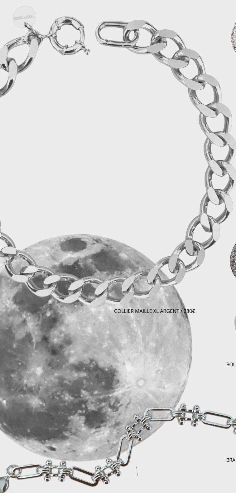
COLLIER MAILLE XL ARGENT / 280€