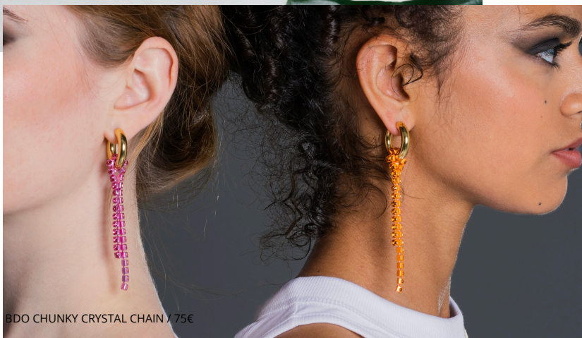
BDO CHUNKY CRYSTAL CHAIN / 75€