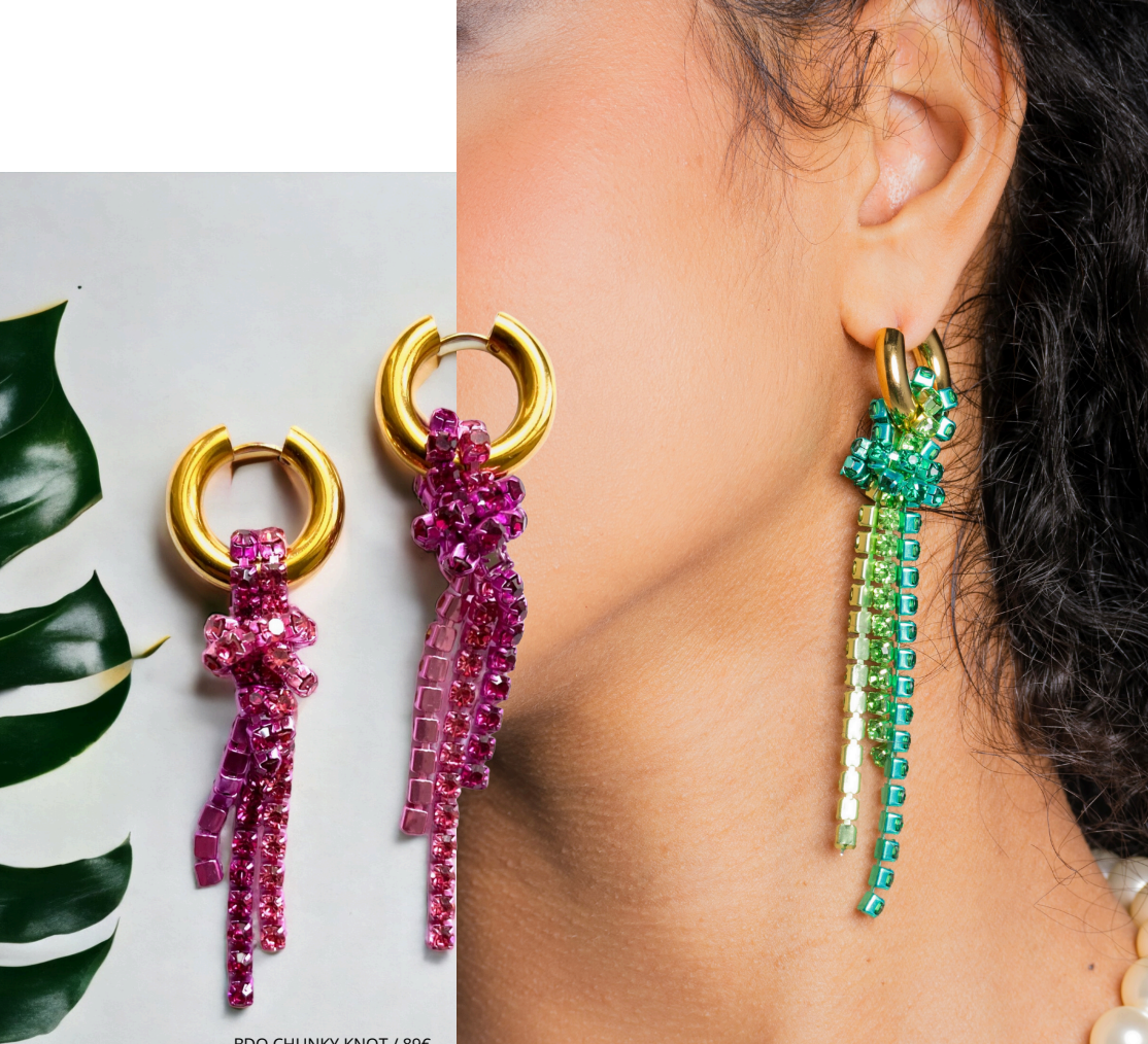
BDO CHUNKY KNOT / 89€