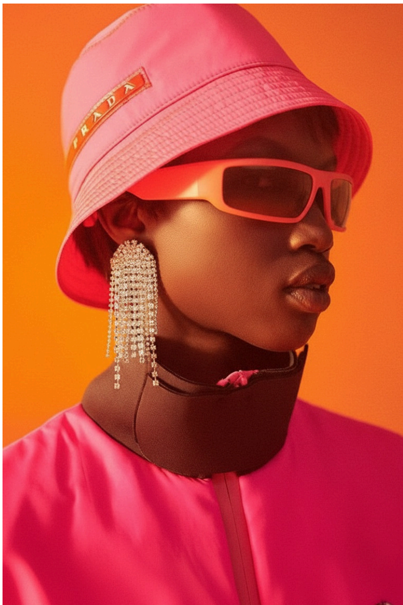
BOUCLES D'OREILLES CASCADE DREAM - SILVER/ 115€