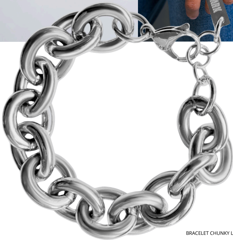
BRACELET CHUNKY LINK - SILVER/ 89€