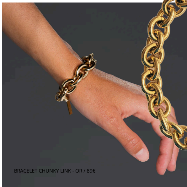
BRACELET CHUNKY LINK - OR / 89€