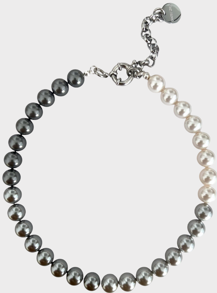
COLLIER MOON PHASE / 115€