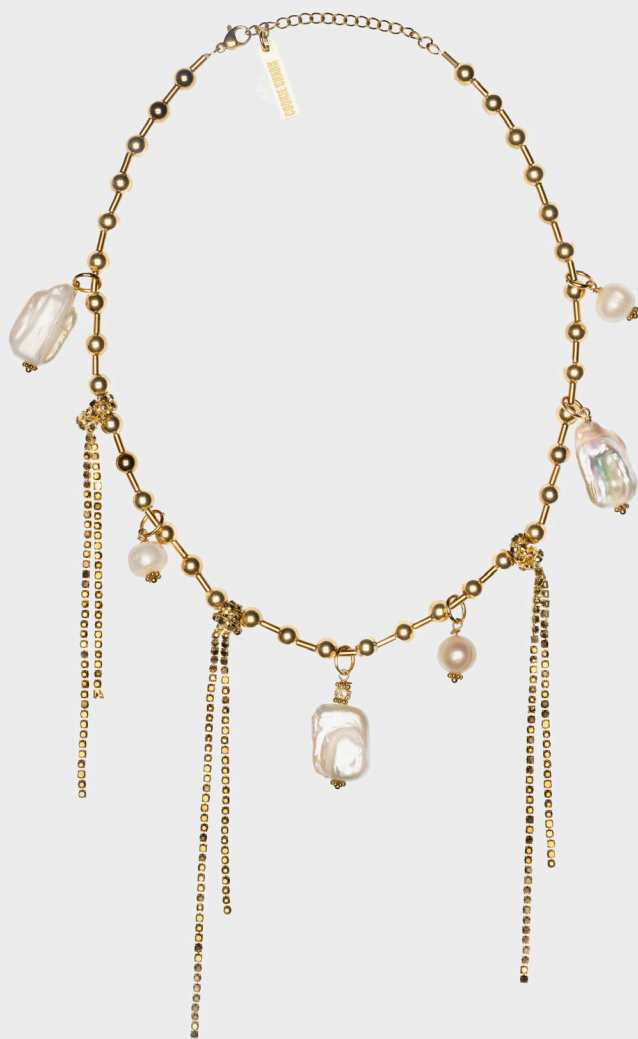
COLIER GLORIA / 155€