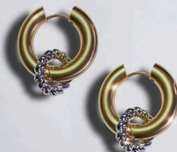
BDO TORSADÉ OR / 60€