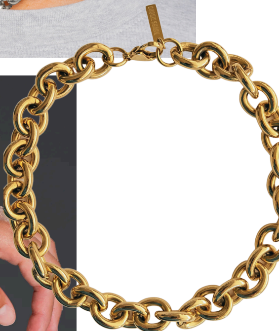
COLLIER CHUNKY LINK - OR / 150€