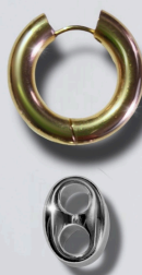
BDO CZN TAB OR / 60€