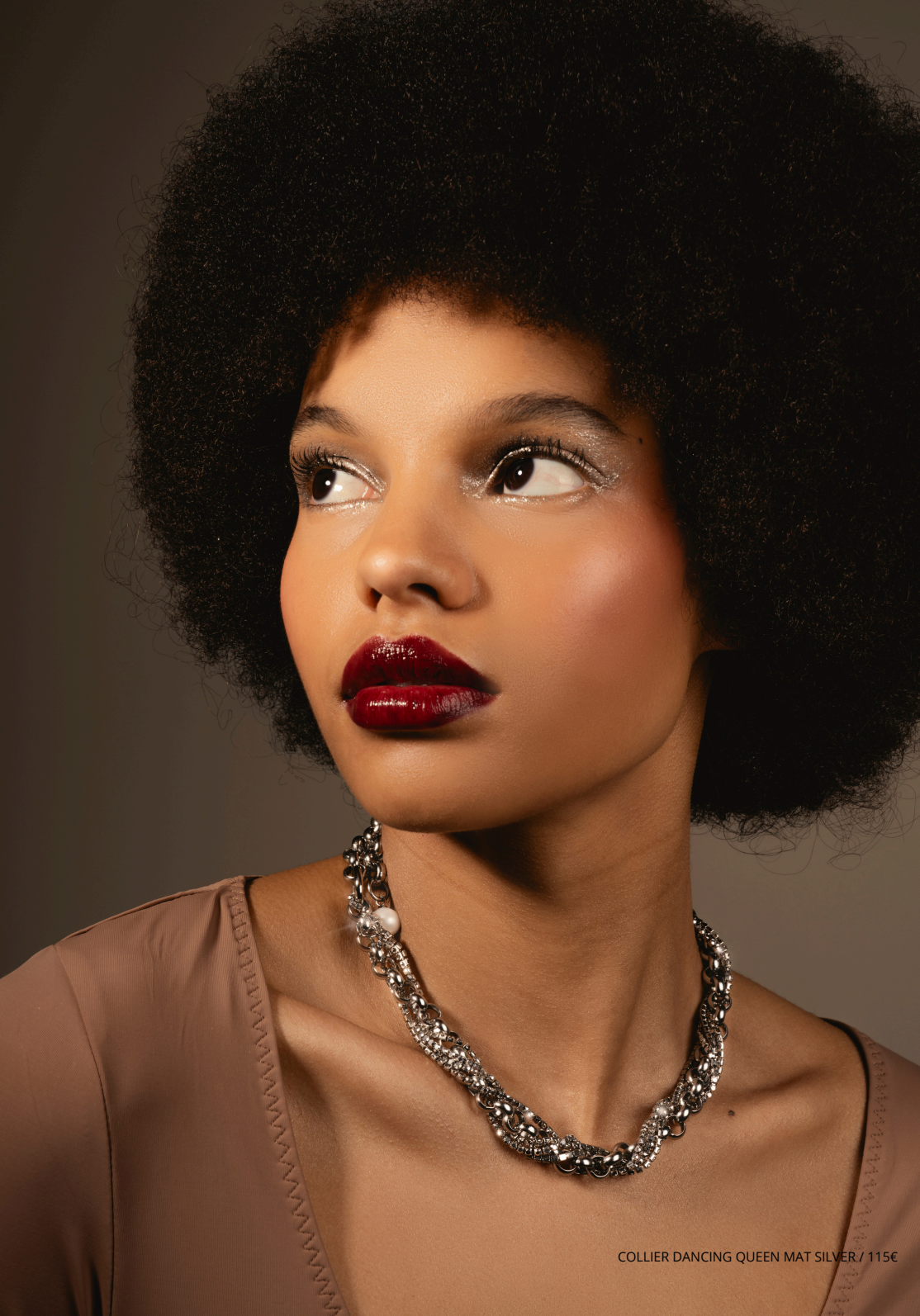
COLLIER DANCING QUEEN MAT SILVER / 115€