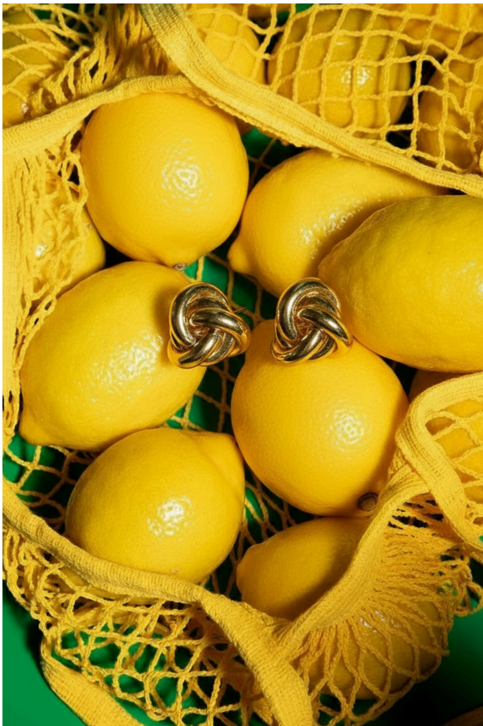
BOUCLES D'OREILLE KNOT - GOLD