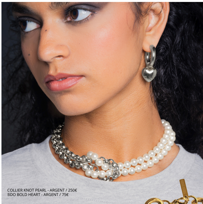
COLLIER KNOT PEARL - ARGENT / 250€ BDO BOLD HEART - ARGENT / 75€