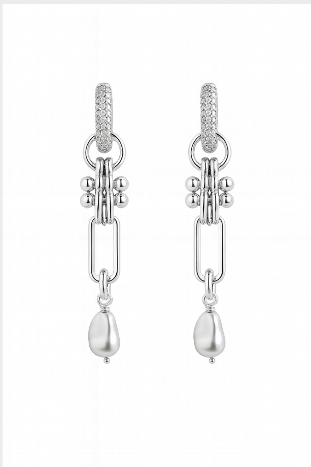
BOUCLES D'OREILLES CONSTELLATION - SILVER/ 95€