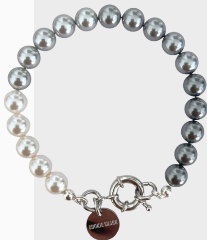
BRACELET MOON PHASE / 75€