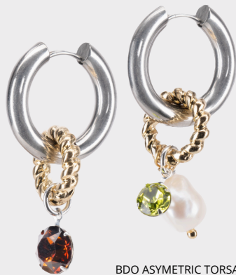
BDO ASYMETRIC TORSADE / 75€