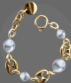
BRACELET CAN TAB / 75€