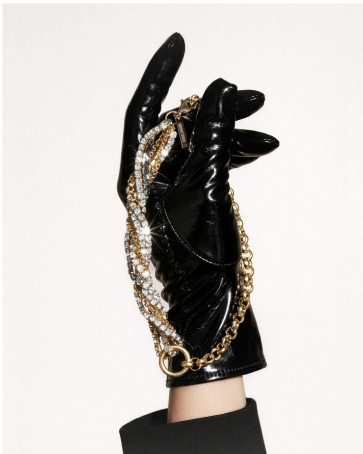
COLLIER CRISTAL RIVER - GOLD/SILVER / 115€