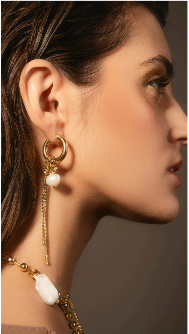
BOUCLES D'OREILLES ASYMETRIC GLORIA GOLD - SILVER/ 75€