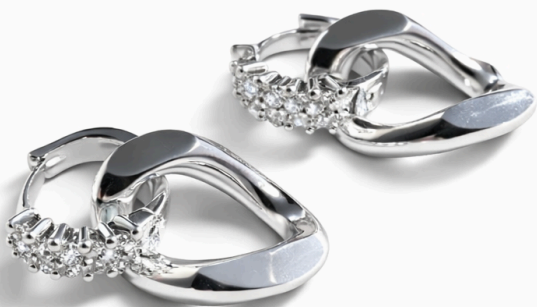
BOUCLES D'OREILLES MAILLE XL - SILVER/ 95€