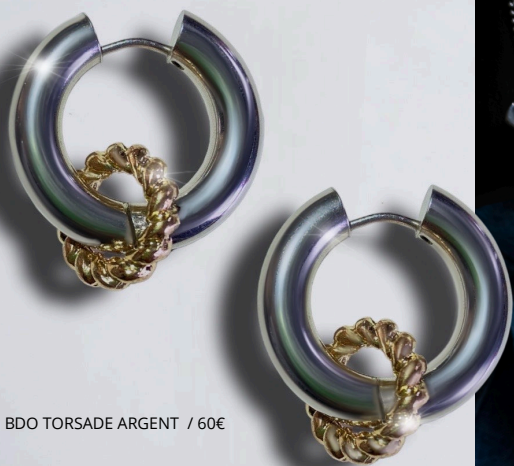
BDO TORSADE ARGENT / 60€