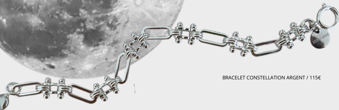
BRACELET CONSTELLATION ARGENT / 115€