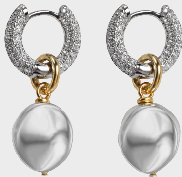
BOUCLES D'OREILLES FULL MOON / 75€